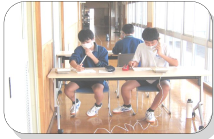
【丁寧な言葉遣いのテレホン係】