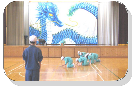
【蒼龍と先輩に見守られての清掃】