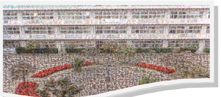
【全校生徒の笑顔が曇ることのないように】

本人が気づかないところで、ウワサをバラまかれたり、ネット上で誹謗中傷されたりして、学校生活や進路に大きな影響を与えることがあります。絶対にしてはならないことです。